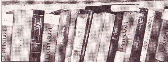
Գրադարանը հարուստ է խիստ արդիական գրականությամբ:

Գյուղատնտեսության նախարարությունը հարցնում է ունեցել ջրի հարցը լուծելու խնդրում, բայց, ինչպես ակնհայտ է եղանք, ջրի հարցը չի լուծվել և չի դադարում տեղաբնակների՝ դույլերով ջուր կրելու «գործընթացը»: Ինչ վերաբերում է գյուղատնտեսության շենքի երկրորդ հարկում ծվարած մշակույթի տանը, դա այլևս փլատակ է: