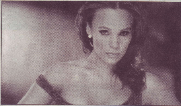
Muy mala. Nuevamente será villana en televisión, ahora en el melodrama Un Refugio para el Amor .

tiene es e físico. es con el edicción de traro ro él es mente por pre- l", indi- decio to- aciones an que- ción.