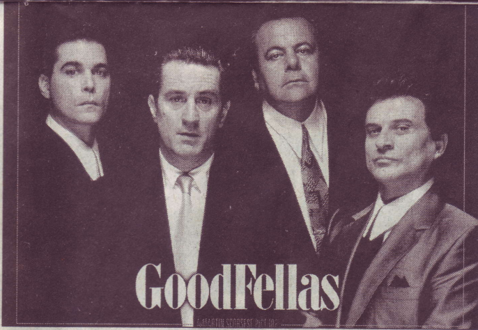
Vuelve. La exitosa historia de mafiosos donde participara Robert De Niro llegará a la pantalla chica.

tratos acerca del mundo de la mafia según la crítica especializada, contaba en su reparto con Ray Liotta, Robert De Niro y Joe Pesci, quien se alzó con el Oscar al mejor ac-